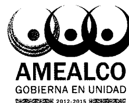
TABLA DE VALORES UNITARIOS DE SUELO PARA PREDIOS RÚSTICOS 2015 VALORES UNITARIOS POR HECTÁREA BASE